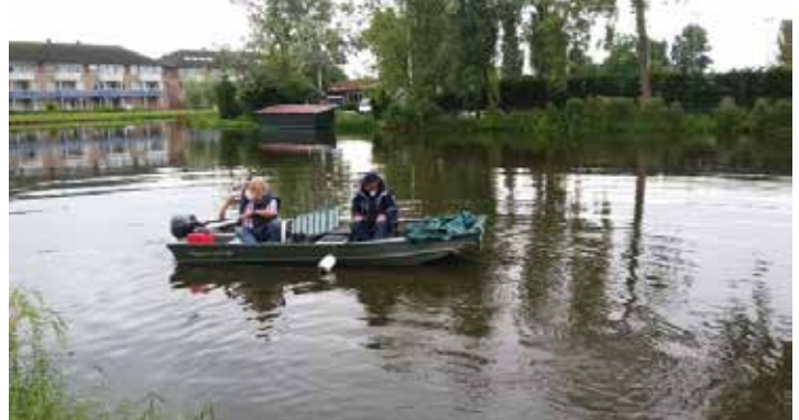
Klaar voor en onderweg naar controle op de Zaan

Sinds kort voer ik ook controles uit met de boot op de Zaan en in het Guisveld. Zelf ben ik niet bepaald een deskundig schipper en ik kan u verzekeren dat, als je op De Zaan een boot benadert met 2 of 3 vissers met aan alle kanten hengels, dat je dan uiterst voorzichtig moet manoeuvreren en dat ga ik nooit meer leren. Gelukkig heb ik een