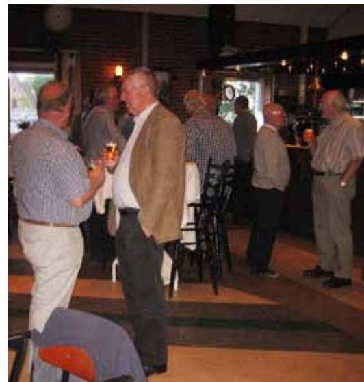
Even bijpraten in de pauze

In de rondvraag doet de heer Groen de suggestie om een enquête te houden naar hoe het HVZ Nieuws door de HVZ leden wordt ervaren. Onder de inzenders kan een prijs worden verloot.